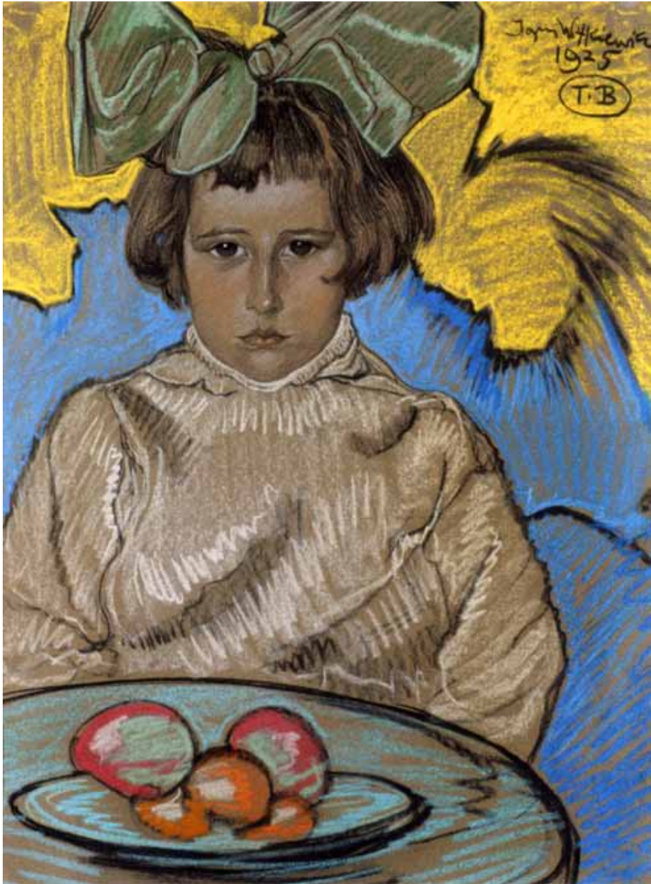
Fot. 2. Stanisław Ignacy Witkiewicz, Portret Anny Nawrockiej , typ B; 1925; pastel, papier; 62×47 cm; wł. Muzeum Pomorza Środkowego w Słupsku, nr inw. MPŚ-M/694.