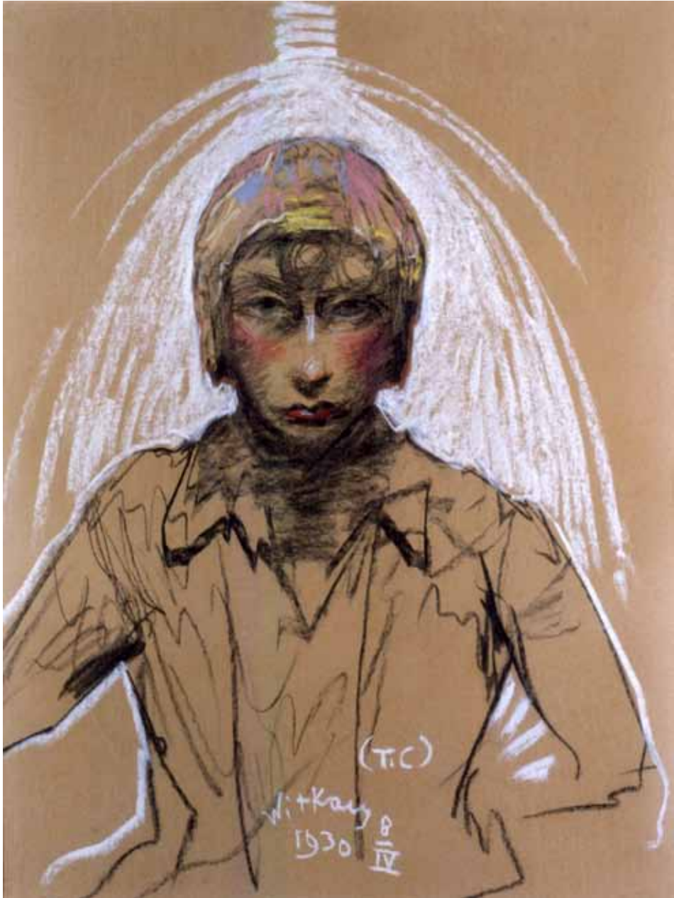
Fot. 4. Stanisław Ignacy Witkiewicz, Portret Neny Stachurskiej , typ C; 8 IV 1930; pastel, papier; 64×49 cm; wł. Muzeum Pomorza Środkowego w Słupsku, nr inw. MPŚ-M/104.