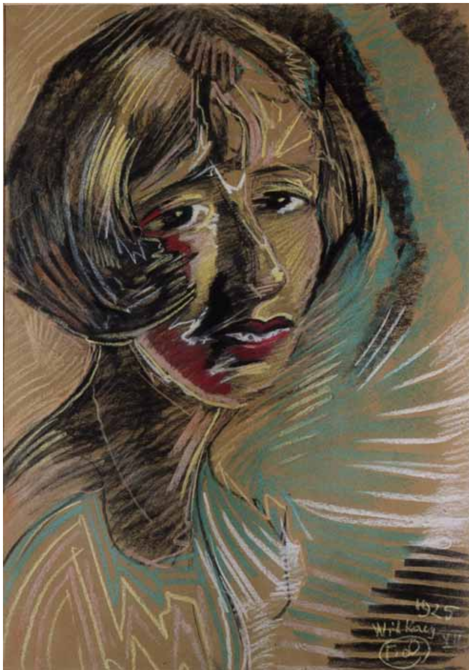
Fot. 5. Stanisław Ignacy Witkiewicz, Portret Leny Iżyckiej, typ D; VII 1925 ; pastel, papier; 72×52 cm; wł. Muzeum Pomorza Środkowego w Słupsku, nr inw. MPŚ-M/1291.