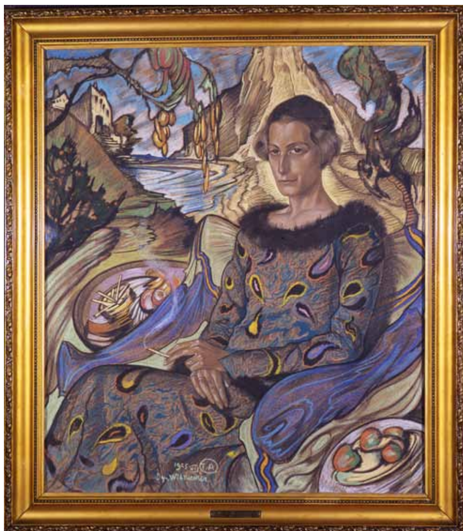
Fot. 1. Stanisław Ignacy Witkiewicz, Portret Marii Nawrockiej, typ A; VII 1925 ; pastel, papier; 115×99 cm; wł. Muzeum Pomorza Środkowego w Słupsku, nr inw. MPŚ-M/682.