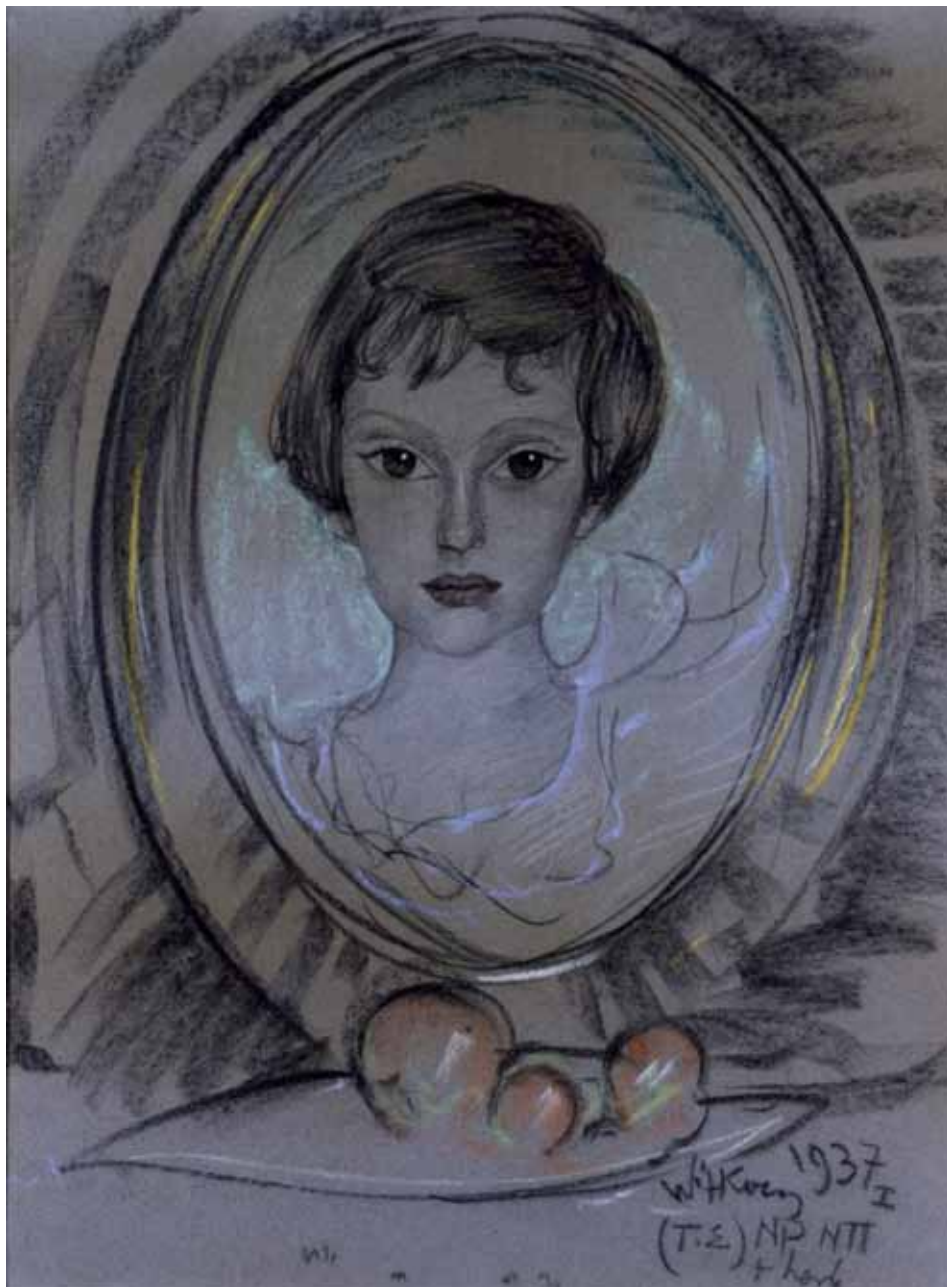
Fot. 6. Stanisław Ignacy Witkiewicz, Portret Ireny Raciborskiej , typ E; I 1937; pastel, papier; 63×48 cm; wł. Muzeum Pomorza Środkowego w Słupsku, nr inw. MPŚ-M/557.