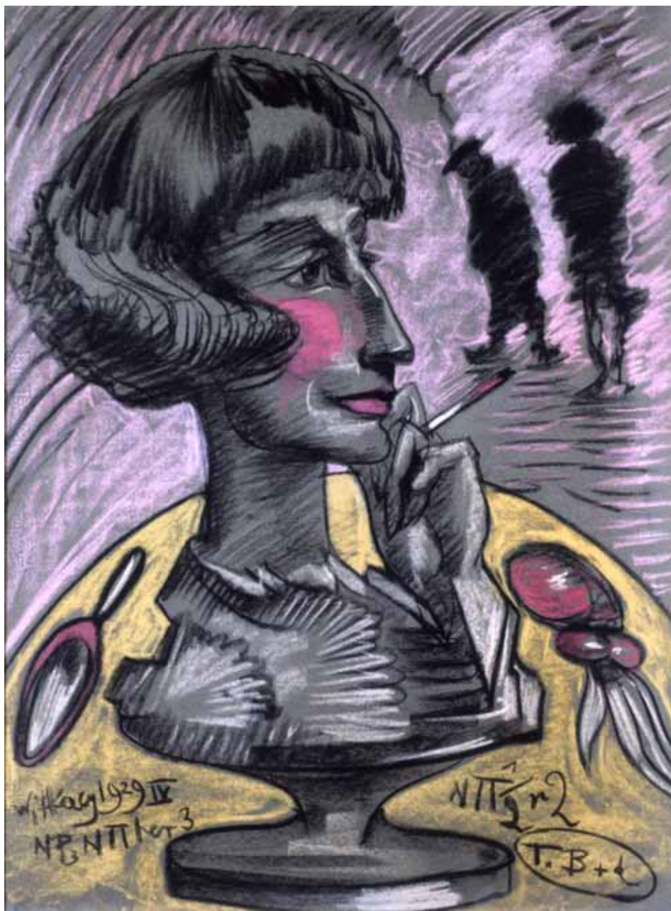
Fot. 3. Stanisław Ignacy Witkiewicz, Portret Marii Nawrockiej , typ B+d; 19 IV 1929; pastel, papier; 63×38 cm; wł. Muzeum Pomorza Środkowego w Słupsku, nr inw. MPŚ-M/712.