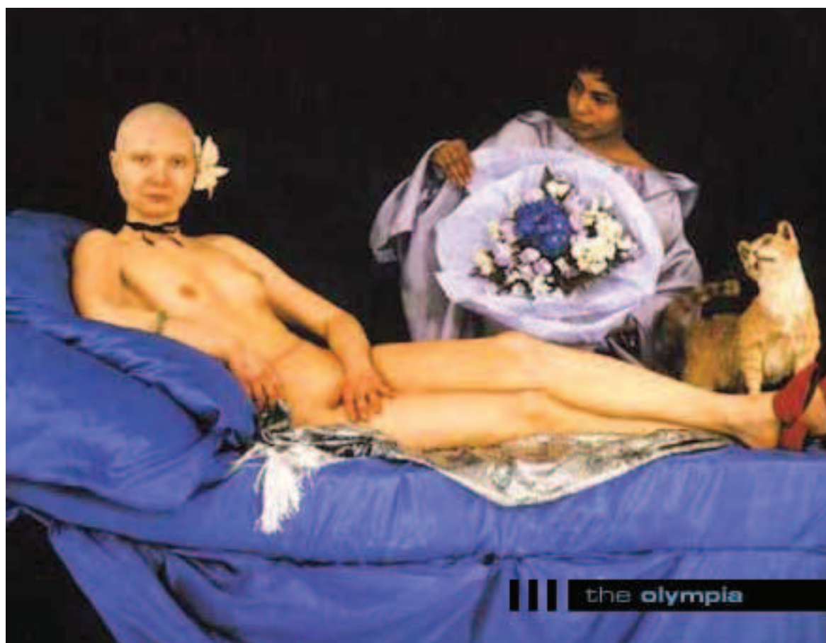
Rycina 2. Katarzyna Kozyra, Olimpia , 1996

Olimpia stała się zapisem zmagania artystki z chorobą nowotworową, a konkretnie ziarnicą złośliwą. Walka artystki o życie trwała trzy lata. Kozyra, podobnie jak w swoim czasie Frida Kahlo, dokonała swym dziełem wyłomu w obowiązującym kanonie estetycznym, podejmując polemikę z kultem ciała młodego, zdrowego, silnego, kontrolowanego. W drastyczny sposób przełamała tym samym tabu związane z intymnością kuracji i jej dotkliwymi skutkami.